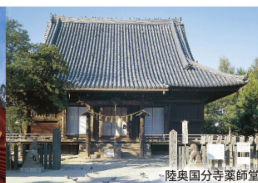
陸奥国分寺薬師堂