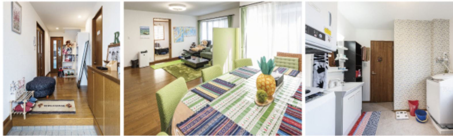
1F 玄関 リビングダイニング 洗面所・浴室