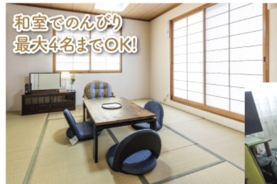
和室でのんびり 最大4名までOK!