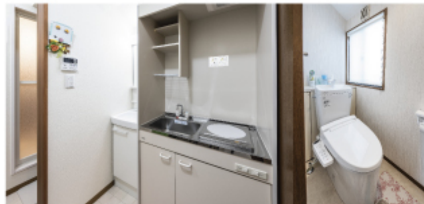
2F ミニキッチン・洗面所・浴室・トイレ